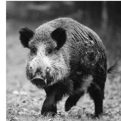
Die Wildschweinpopulation kann ein Virusreservoir für das Schweinepestvirus darstellen.

Auch bei der Verbreitung der afrikanischen Schweinepest spielt neben dem direkten Kontakt zwischen erkrankten und gesunden Schweinen die Verfütterung von ungenügend erhitzten Fleischabfällen (Ausbrüche in Belgien, Holland) eine wichtige Rolle. In Afrika bilden Zecken und Warzenschweine das Virusreservoir. Auch auf der Iberischen Halbinsel sind Lederzecken als Erregerreservoir und Überträger des Virus festgestellt worden. Für die Schweine in Europa und Deutschland herrscht eine ständige Bedrohung durch illegalen Import von Fleischerzeugnissen im Reiseverkehr.