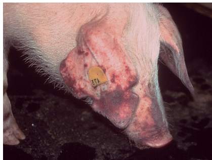
Mastschwein mit Symptomen einer akuten Infektion mit dem Virus der klassischen Schweinepest; es sind hochgradige Blutungen am Ohr zu erkennen